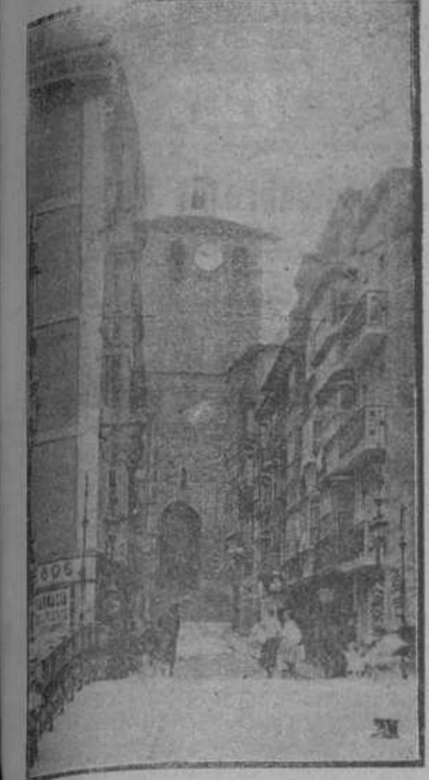
CALLE DEL PUENTE