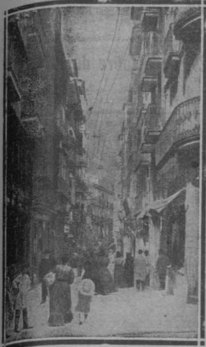
CALLE DE SAN FRANCISCO

Este sólo epigrafe es la mejor garantía de cuanto nosotros pudiéramos decir en favor de tan acreditada Casa. Ella tiene la especialidad en los retratos hechos al carbón y por los procedimientos más modernos hasta el día. Sus artísticas y preciosas ampliaciones desde el el inverosímil precio de tres pesetas, han hecho enteramente imposible toda competencia de otros establecimientos similares. A los sesenta minutos de su encargo, entrega perfectísimas fotografías para carnets, pasaportes, pases, etc., etc. De la manera en que se encuentra acreditada la Fotografía BENJAMIN, es el más fiel testimonio, la clase de clientela de la misma. Personas de la realza y grandeza es panteón, aristocráticas de toda la península y la más granada de nuestra buena sociedad santanderina, han desfilado por esta fotografía modelo, por ser ella la que más se distingue en la calidad, economía y perfección de los trabajos que entrega. Y por si algo faltase, su inteligente propietario ha tenido el acierto de instalar su primorosa Casa en la calle de SAN FRANCISCO, NUMERO 29, donde a diario, le abruma el trabajo de su distinguidísima clientela.