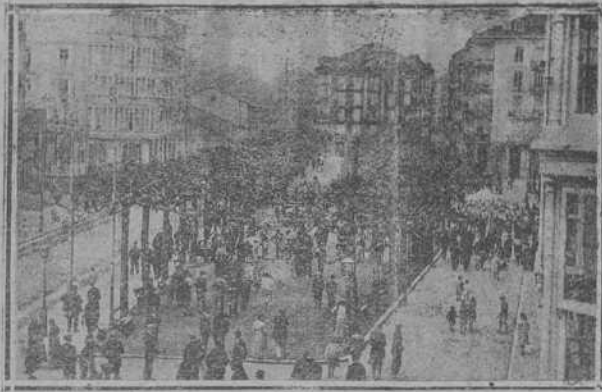
ALAMEDA DE JESUS DE MONASTERIO