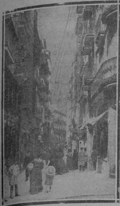
CALLE DE SAN FRANCISCO

Este solo epígrafe es la mejor garantía de cuanto nosotros pudiéramos decir en favor de tan acreditada Casa.