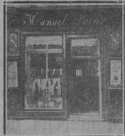
SAN FRANCISCO, NUM. 17

NOVEDADES EN MERCERÍA Y BISUTERÍA -- ESPECIALIDAD EN MEDIAS DE TODAS CLASES -- GRAN SURTIDO EN MONEDEROS Y ABANICOS -- PERFUMERÍA Y CAMISERÍA