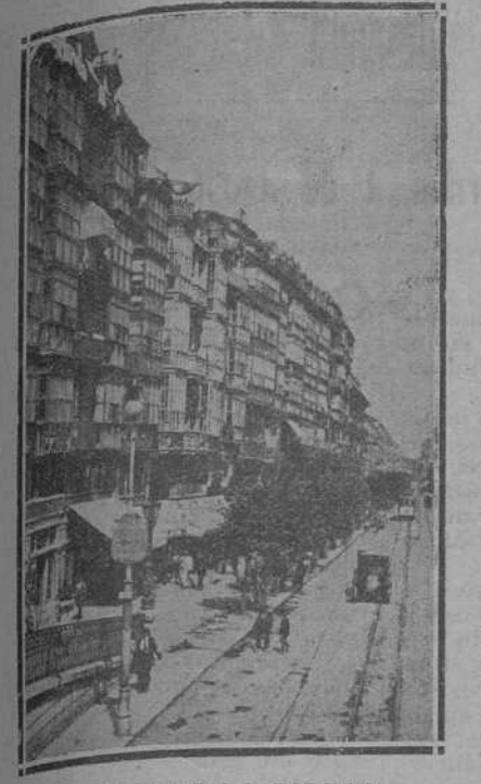
CALLE DE LA RIBERA