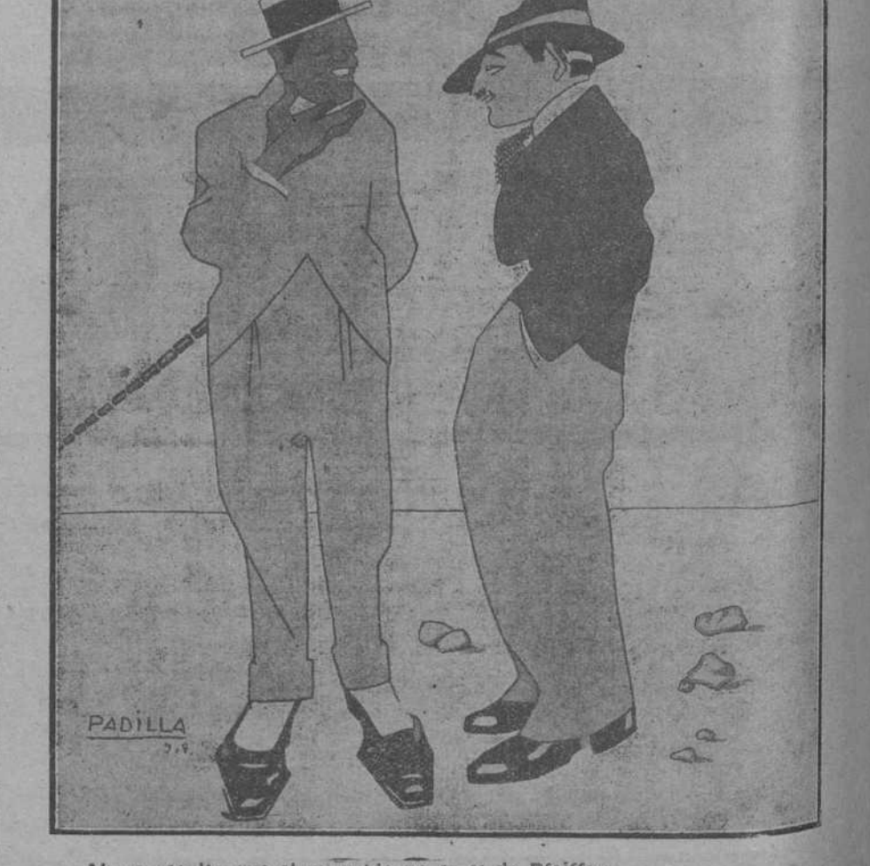
—Ahora resulta que el microbio no es el de Pfeiffer. —No? Pues habrá que tributarle algunas manifestaciones de desagravio.