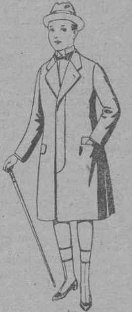
Gabanes de patén, para niños de 10 a 12 años. De pesetas 18 a 55. Los mismos, para juveniles de 13 a 16 años. De pesetas 21 a 58.