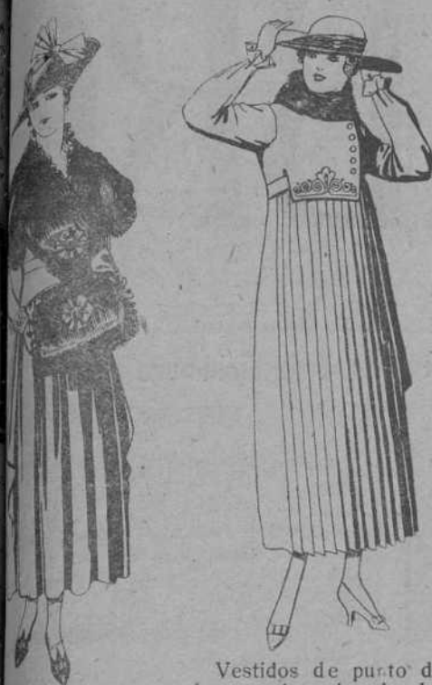
Vestidos de punto de lana azul y color, bordados, cue'lo piel. De pesetas 95 a 107. Vestidos de pieles: neblina Renard. De pesetas 58.