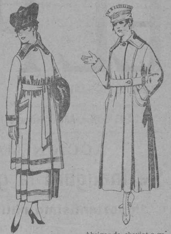
Abrigos de cheviot o gamuza, en azul, negro y colores. De pesetas 45 a 56. Trajes de sarga inglesa, en negro y azul, bordados. De pesetas 85 a 100.