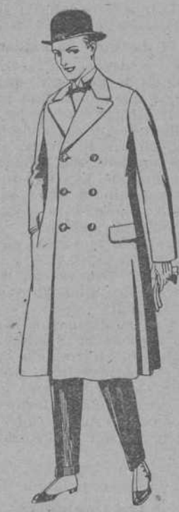
Gabanes de patén, gamuza o Cover. De pesetas 50 a 100.