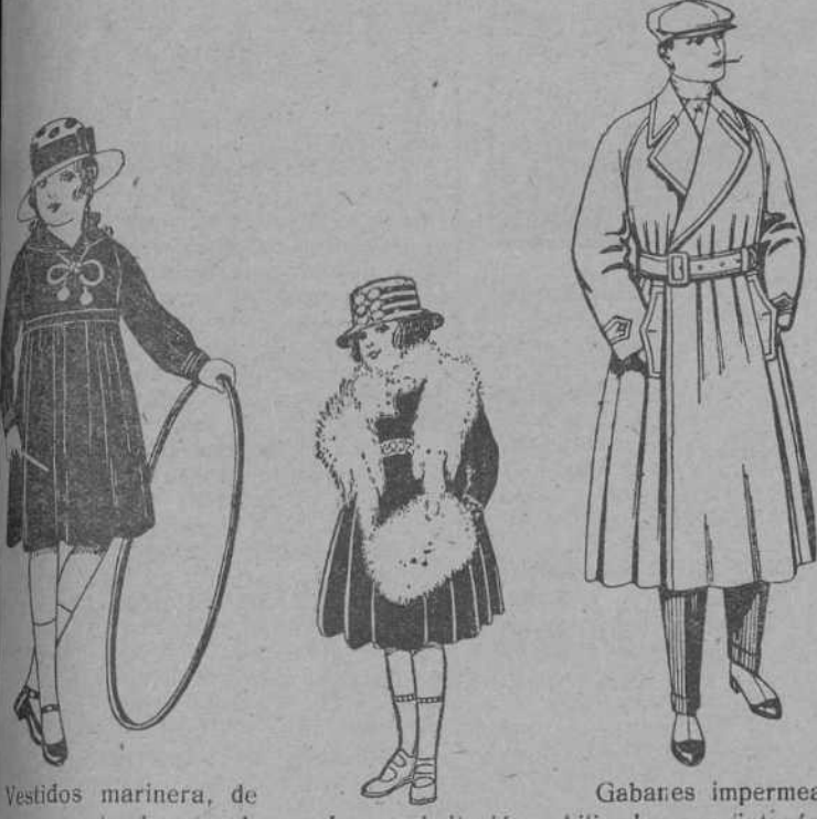
Vestidos marinera, de lana o estambre azul, con seda blancos. De pesetas 25 a 37. Juegos imitación Renard, blancos. A pesetas 12. Gabanes impermeabilizados, con cinturón, color beige. De pesetas 43 a 15.