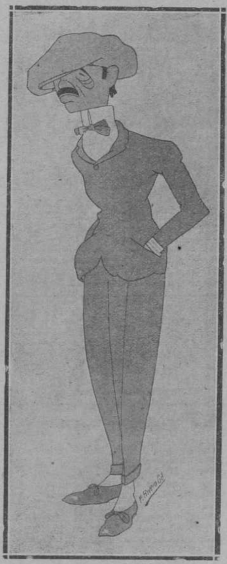
Por F. Rivero Gil.