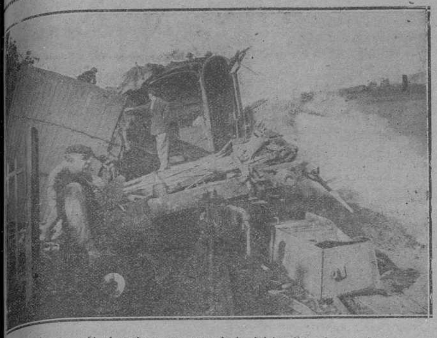
En que quedó el coche cama por efecto del terrible choque.