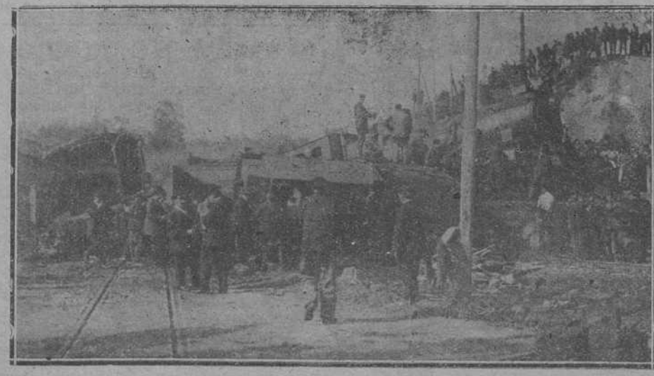
Un aspecto del lugar del siniestro des de la línea del ferrocarril Cantábrico.

GRAN PENSIONADO.—Señoritas de Rodríguez, Gómez Oreña, número 3.