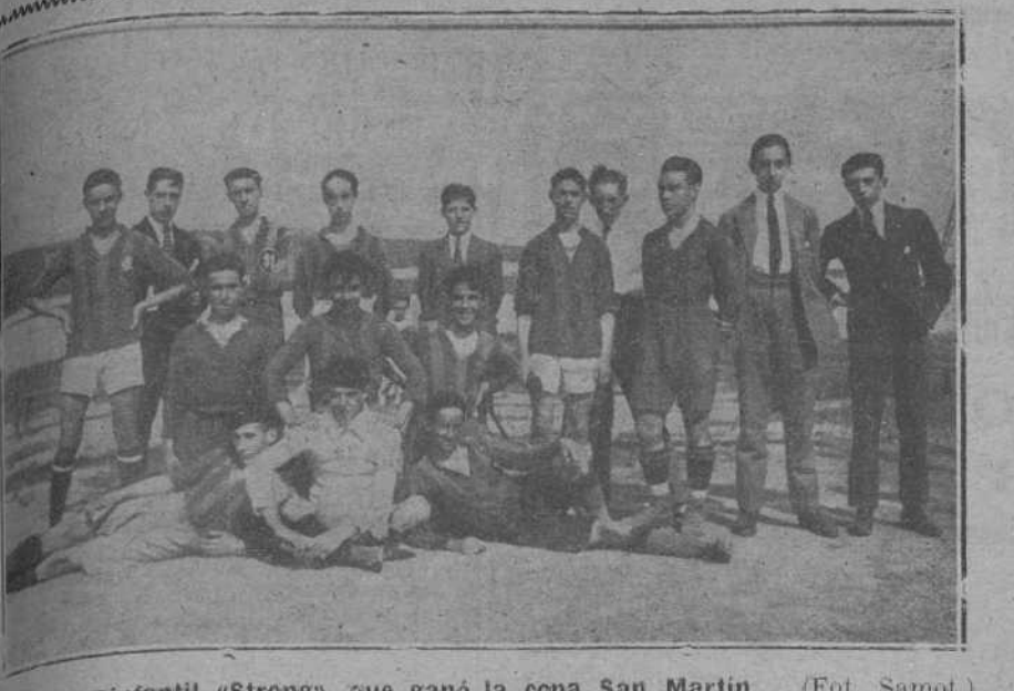
El equipo infantil «Strong», que ganó la copa San Martín.

Seguidamente, el gobernador civil, señor Richi, en breves y sentidas frases, declaró abierto al curso escolar de 1917 a 1918, dándose por terminado el acto.