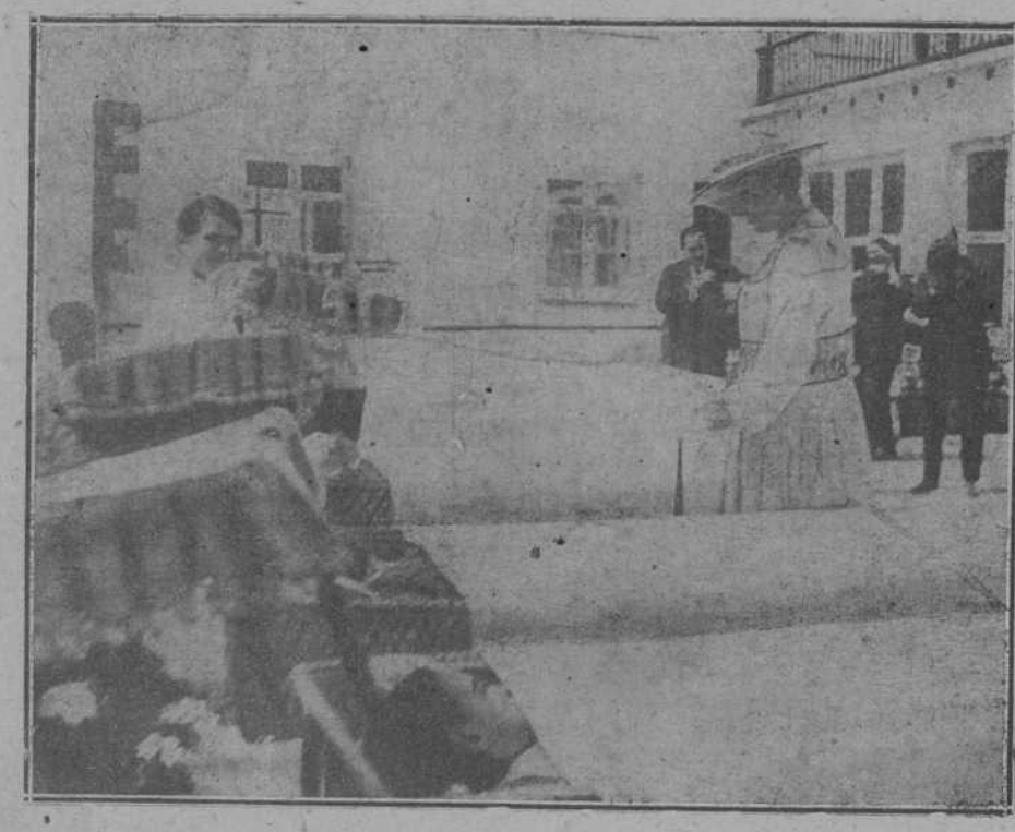
Su Majestad la Reina en la visita que hizo al Sanatorio de Pedrosa hablando con los niños que encuentran tomando baños de sol.