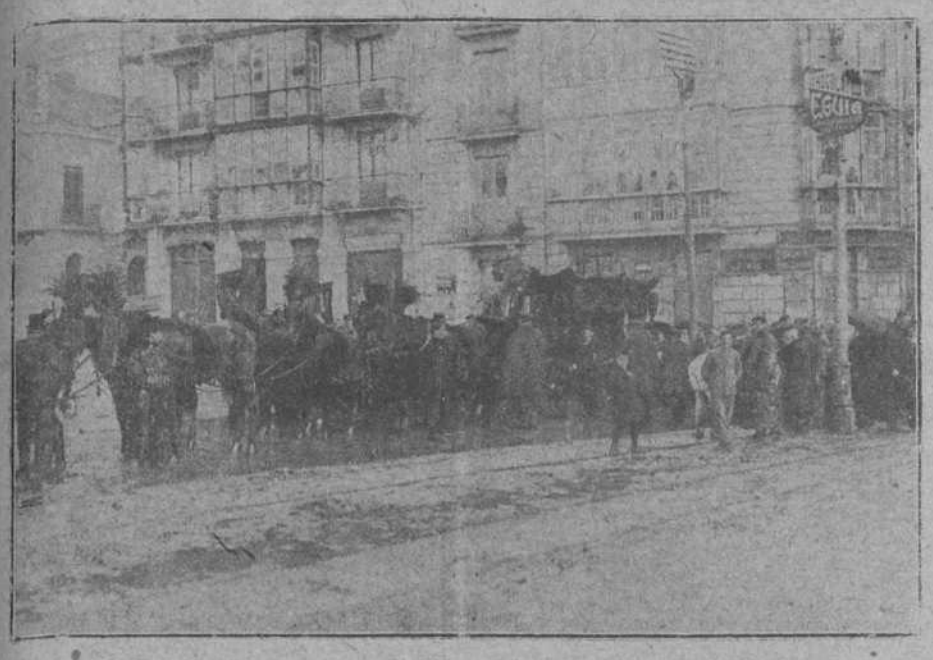
El entierro de don Fernando Calderón de la Barca y Bustamante de Quevedo. Momento de ser colocado el féretro en el furgón automovilístico de la funeraria de don Ángel Blanco, para ser conducido al cementerio de Cotillo de Anievas.