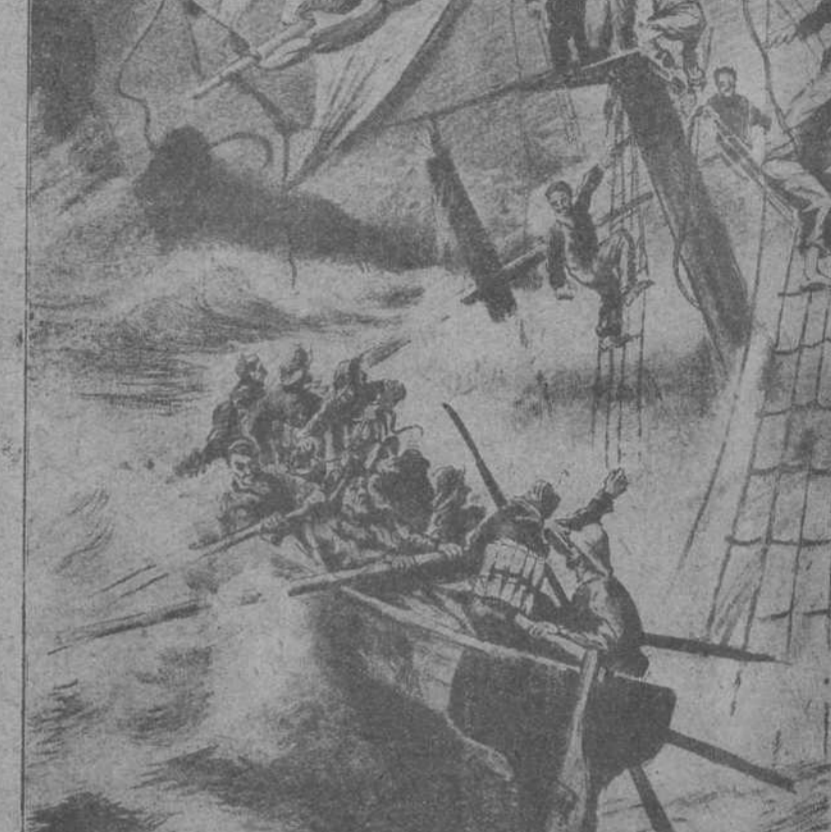
Horrible naufragio en Santander