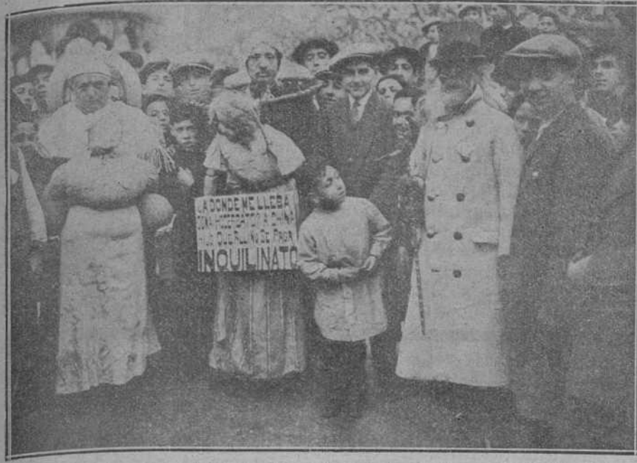
EL CARNAVAL EN SANTANDER.—Mascarada política protestando del impuesto de inquilinato.