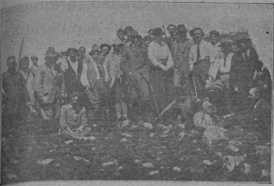
LAS CACERIAS DEL REY.—DON ALFONSO XIII Y SUS ACOMPAÑANTES EN EL MONTE DE SAJÁ DESPUÉS DE LA PRIMERA BATIDA

había marchado a Madrid, y que igualmente había salido para Laredo el gobernador de esta provincia, quedando en San Sebastián unos días más el gobernador civil de Ciudad Real.