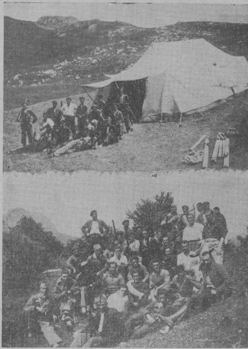
Las valientes milicias de los valles altos de Liébana han establecido puestos avanzados en el puerto de Piedrasluengas. En uno de estos puestos han sido tomadas por Bustamante estas dos «fotos» que ofrecemos hoy a nuestros lectores.

Hoy, miércoles, a las diez y media de la mañana, hablará el profesor señor Cabrera, rector de la Universidad, sobre «La física de Newton».