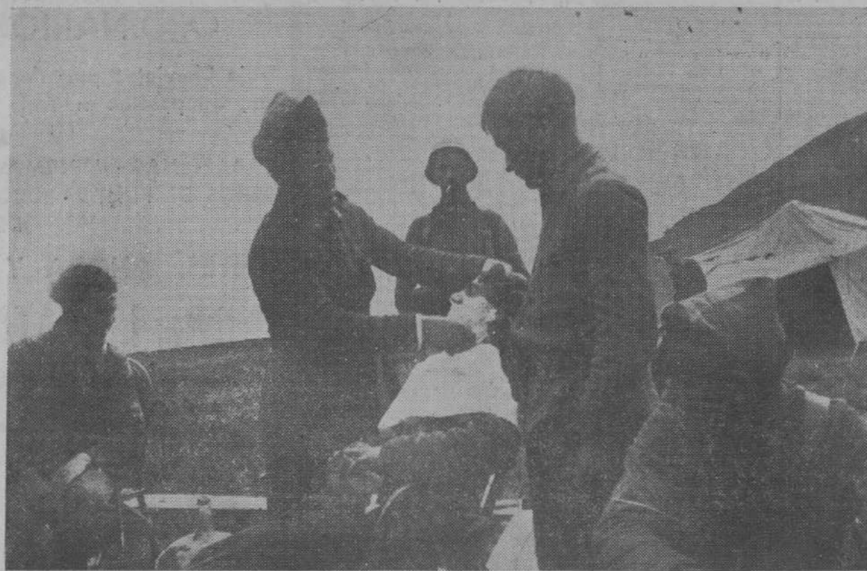
ESCENAS DEL FRENTE.—Una barboria al aire libre y en plena sierra.