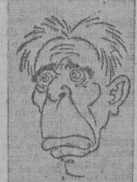
El repórter número 1

HENRI DESGRANGE El inventor y "fabricante de la Vuelta Ciclista a Francia", que en la actualidad está viendo cómo se desarrolla su XXX representación. ¡Leor al "papá" de la excelente prueba, como lo llaman "sus" ciclistas.