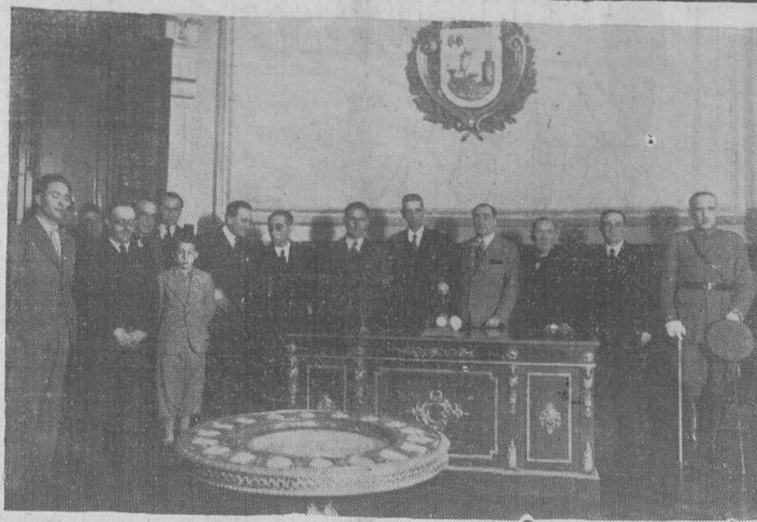
El notable aviador cubano Menéndez, con el embajador de su país y las autoridades locales, en el salón de la Alcaldía, poco después de su llegada a nuestra ciudad.

El patrimonio político ciudadano es el voto. A votar, pues.