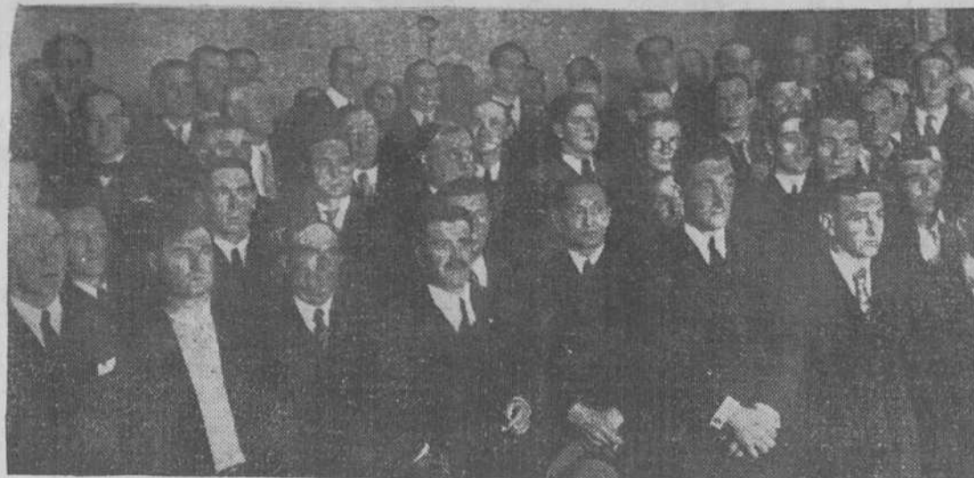
Como consecuencia de la reunión celebrada en Santoña, en el ministerio de Trabajo se ha verificado una Asamblea de pescadores y conserveros del litoral Cantábrico—de la que ayer informamos ampliamente a nuestros lectores—para tratar del grave problema planteado a la industria de la anchoa con motivo de la suspensión de exportación a Italia. En el grabado, concurrentes al importante acto.

Enfermedades del sistema nervioso. Consulta de 11 a 1 y de 3 a 5. CASTELLAN, 1. — Teléfono 11-12