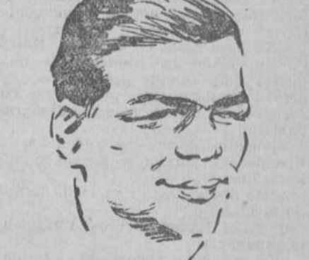
SCHMELING MAX SCHMELING A NUEVA YORK

Anibal Prior debutará en Lisboa el próximo día 21, ante un adversario aun no designado.