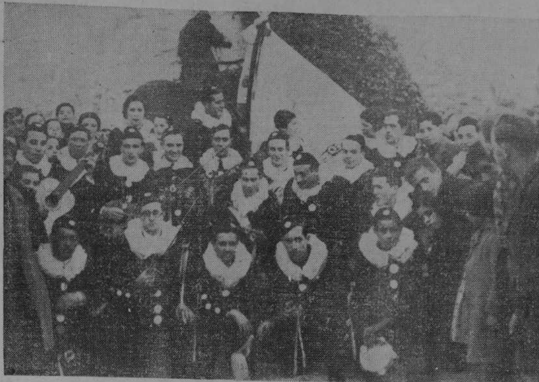
La notable rondalla de la Agrupación Artística Reinosana, que es estos días aplaudida por el público de Santander.

Y porque conviene a todos conocer las pruebas del anterior aserto, he aquí el botón de muestra, bien característico, por cierto, dada la ideología del diario a que se refiere. «Los antecedentes del señor Azaña como gobernante, complicados ahora con las alianzas que sirven de nexo al Frente Popular, habían hecho tener actitudes y modos escasamente gratos. El tono de cierta Prensa tampoco contribuía a tranquilizar demasiado los ánimos. El señor Azaña ha hablado de justicia, y apetece al espíritu un poco conturbado reposarse en la confianza de que el señor Azaña, que conoce el valor de las palabras, emplee cada una con un sentido exacto de su dimensión. Anima a suponer que sea así la experiencia adquirida por el presidente del Consejo en su anterior etapa de gobierno. Esperamos que la conciencia de su responsabilidad histórica y un sentido de la medida y del buen gusto—que no es posible negarle al señor Azaña—, le señalen el lugar y el modo que le corresponde en esta hora en que no todo son facilidades para su tarea... Ayer, por vez primera en su vida pública, el señor Azaña se creyó en el caso de hablar para los republicanos y para los no republicanos. No republicanos, pero españoles, sabemos en este momento cuál es nuestro deber. Es el de buscar la posibilidad de un último y remoto nexo espiritual con otros españoles tan alejados de nuestras posiciones y obedientes a su vibración a la hora en que la angustia de España lo pida.» Tal dice «La Epoca».