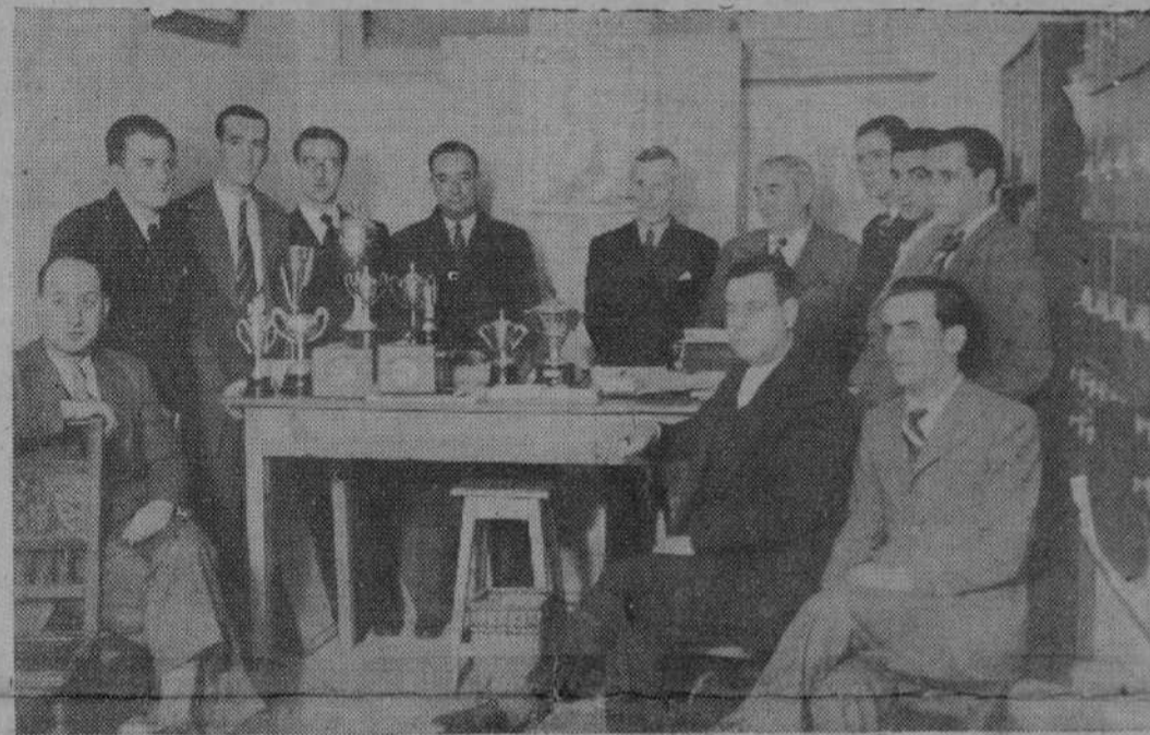
En la Sociedad Colombiña Montañesa se verificó el domingo el reparto de premios de los concursos de Aguilar y Palencia. La foto recoge un momento del acto.

LA VOZ DE CANTABRIA desea a sus lectoras y anunciantes feliz salida del 1935 y un tranquilo y próspero año de 1936