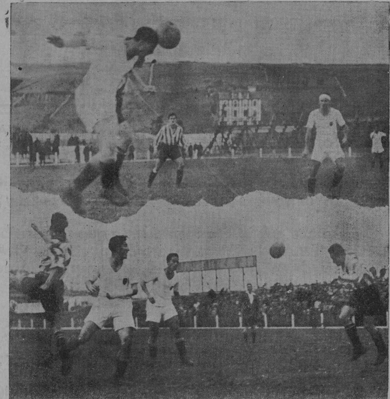
EL DOMINGO, EN EL SARDINERO. —El Racing, en una espléndida actuación de sus cinco delanteros, obtuvo el domingo una brillante victoria sobre el Valencia F. C., al que derrotó por seis goles a dos. He aquí dos interesantes momentos del partido.