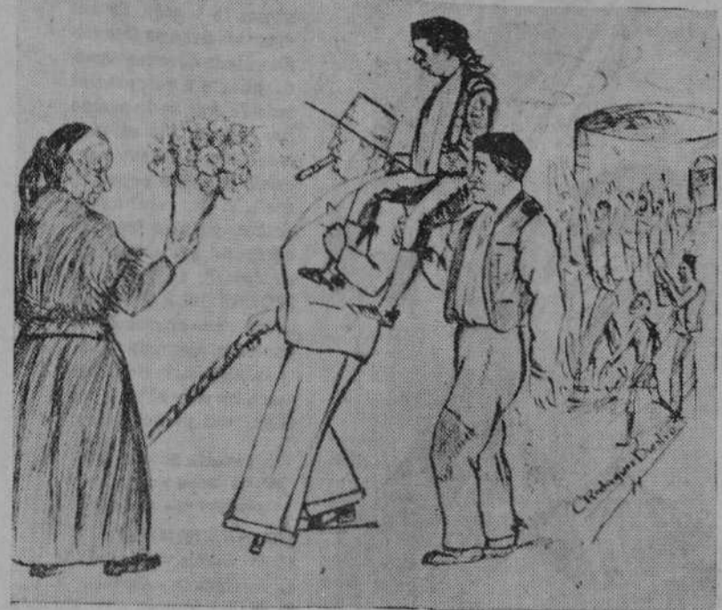
«El Andalúz», con su brazo en cábestrillo, pregonero de un pundonor reconocido, sale en hombros de la plaza de Torrelavega.

Como decimos, en Laredo se comentaba ayer mucho este histórico hallazgo, y eran muchísimas las personas que fueron a la parroquia a contemplar la antiquísima losa sepulcral.—ABASY.