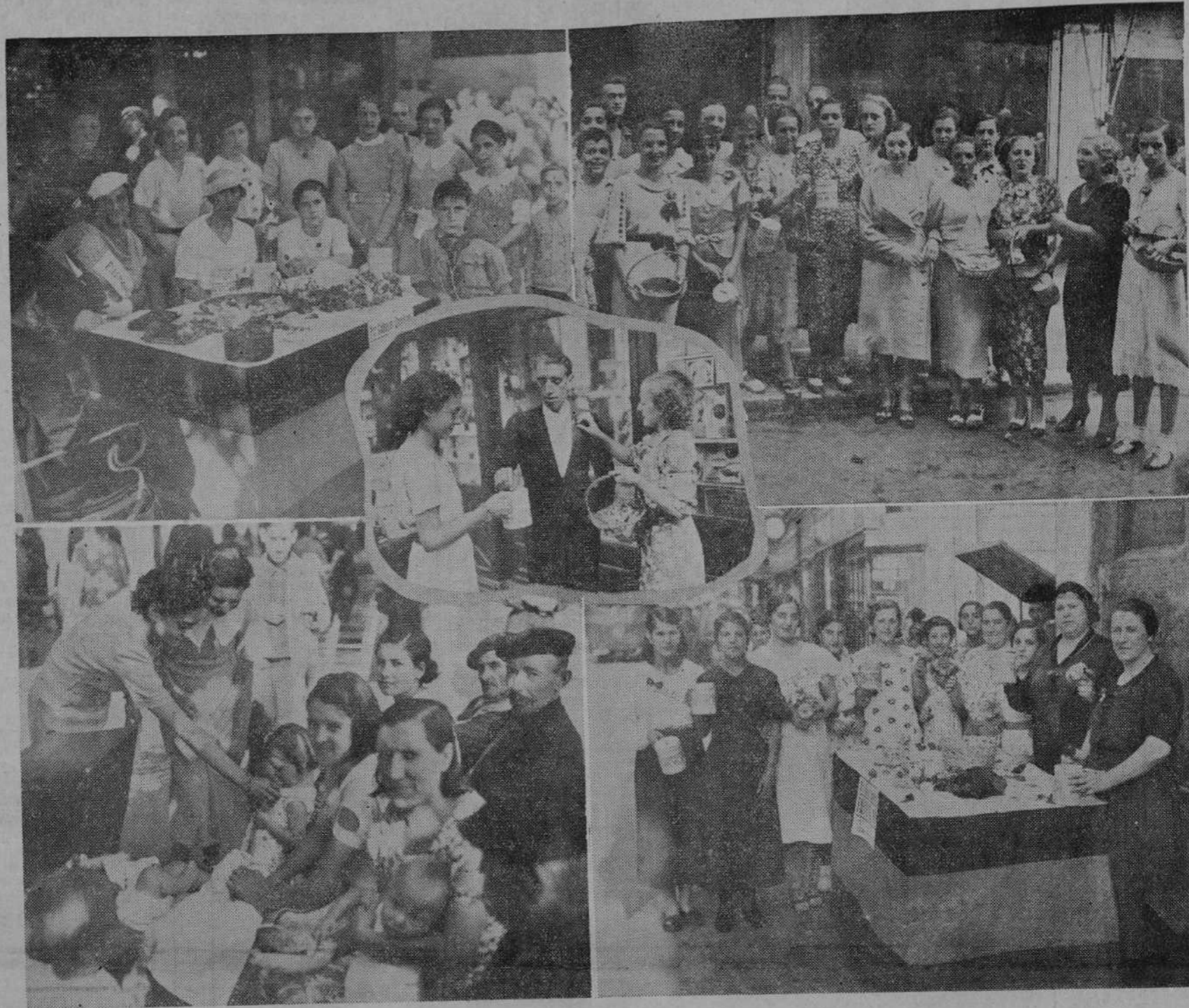
VARIOS INTERESANTES MOMENTOS DE LA FIESTA DEL NIÑO, CELEBRADA AYER.

Como anunciáramos, el pasado domingo tuvo lugar en el precioso lugar de la Feria de Muestras la gran verbena popular de la Fiesta del Niño, anunciada con profusión durante todo el día con programas y por el pasacalle que hicieron las Bandas Militar y Municipal.