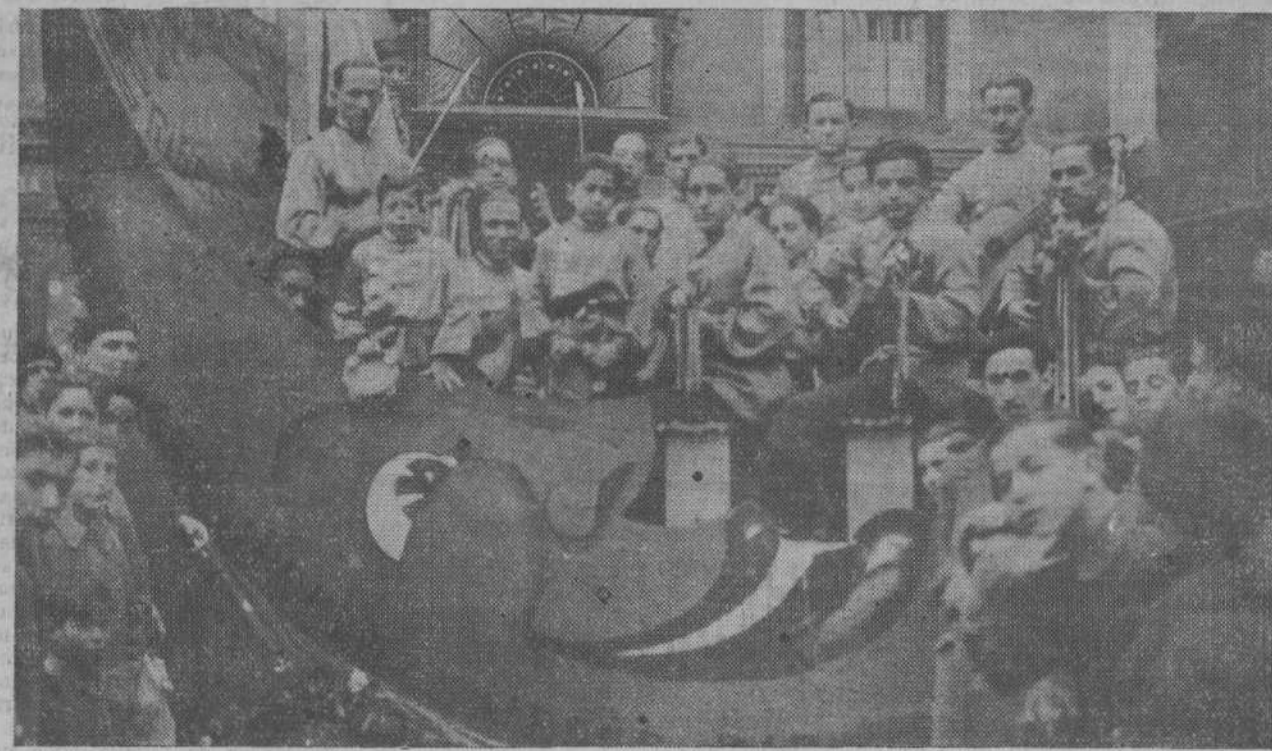
La notable rondalla «Peña Kattuska», nota destacada de los pasados Carnavales en Santander y cuyo rasgo postular a beneficio de La Caridad ha sido unánimemente elogiado.