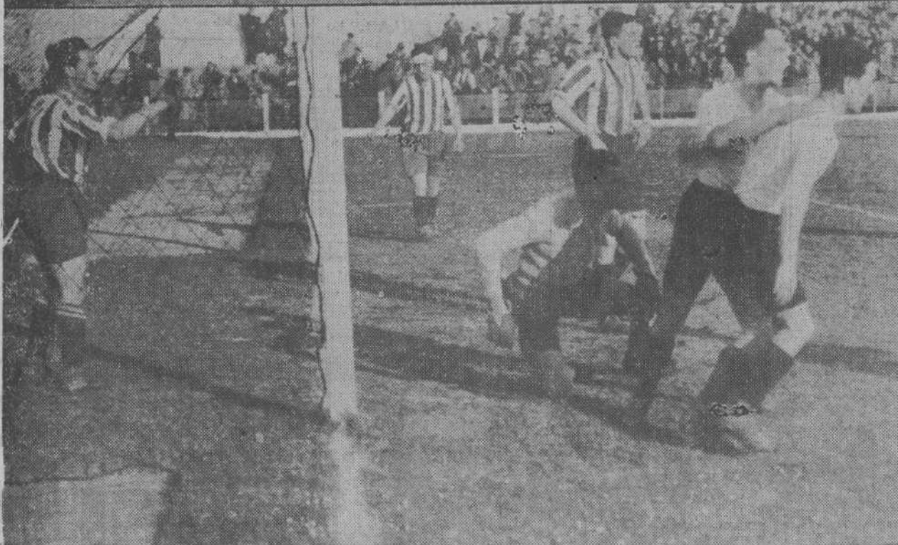
He aquí al equipo del Racing, que el domingo se limitó a vencer por juego y a empatar por goals con el Athletic de Madrid.—Acaba de marcarse el primer tanto de la tarde. El autor, es «sacado a escena» por el compañero que le abraza.