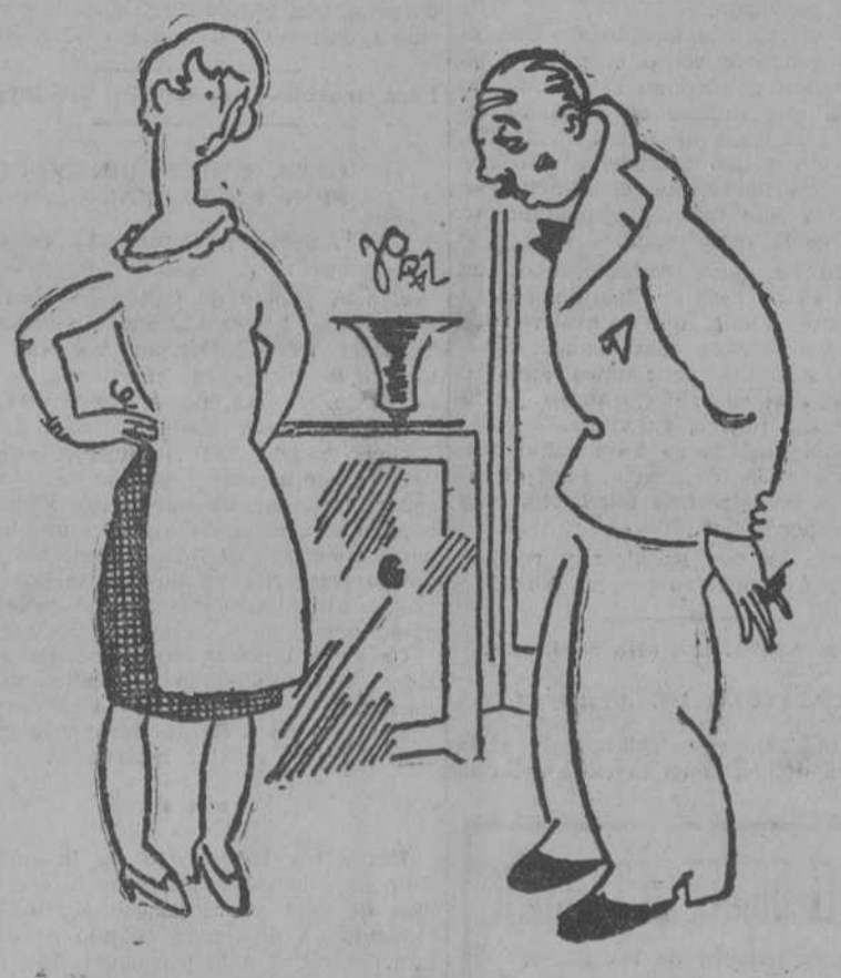
—No hace usted absolutamente nada, mete los dedos sucios en los platos, deja usted que el polvo nos coma, se ha vuelto grosero y mal educado. ¿Es que se cree usted el ama de la casa?