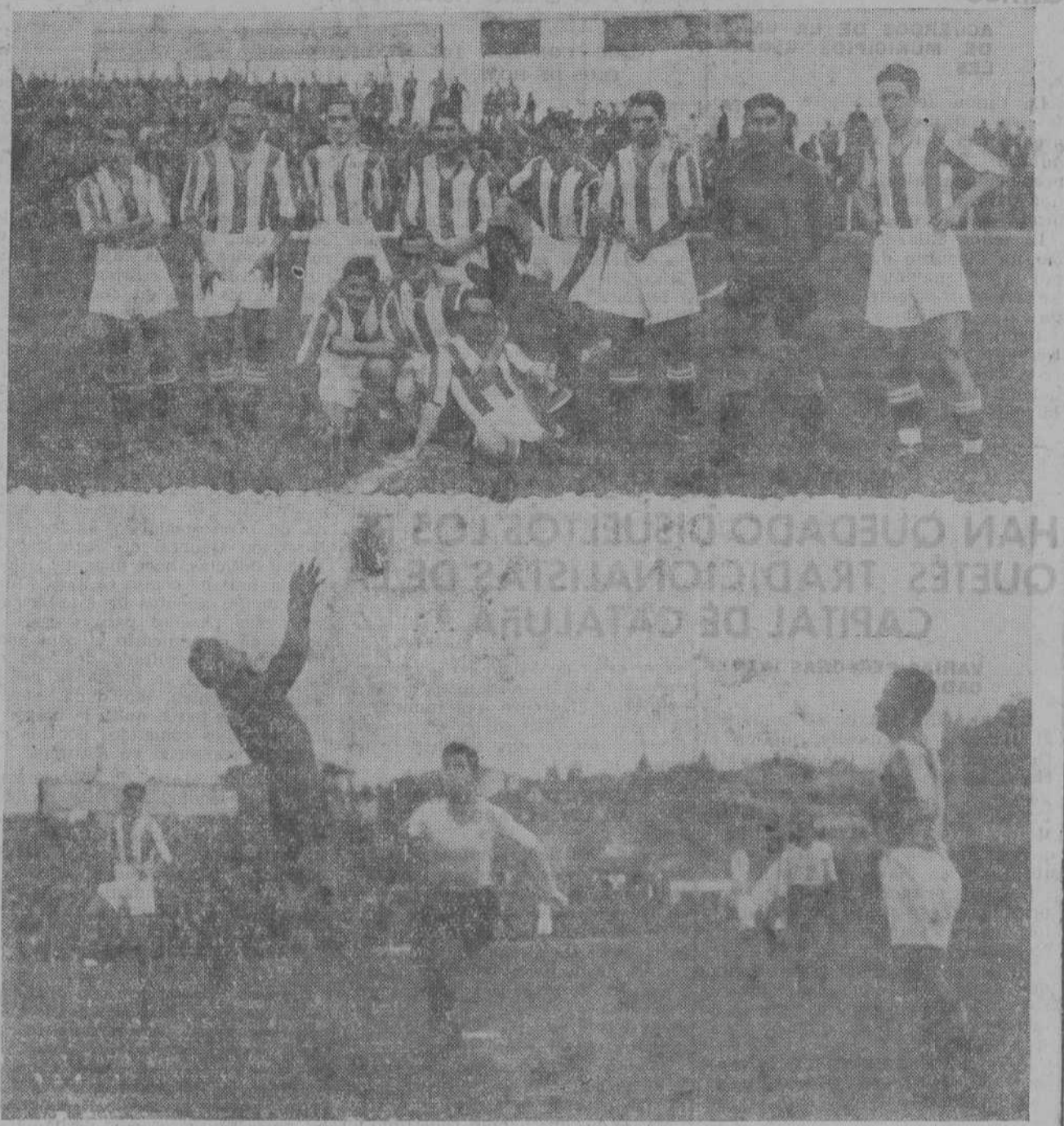
RACING, 2-DONOSTIA, 1, EN EL SARDINERO.—Dos detalles del encuentro que inició la serie inabarcable de emociones ligueras. Arriba, el bravo y entusiasmado equipo donostiarra, que trajo en jaque toda la tarde del domingo al Racing en su propia sala del «cuerno del francés». Abajo, uno de los treinta y tres mil momentos de acción de Arteché a Rojo y una de las afortunadas y abundantes intervenciones del guardameta donostiarra. (F.º A.)

BARCELONA.—La Federación Española de Boxeo, por decisión del pasado sábado, ha desposeído de su título a Paulino Uzcudun, debido a no haberlo puesto en juego ante Isidor.