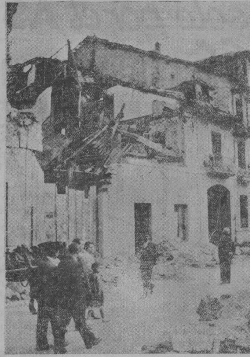
La voladura del Instituto de Oviedo por los revolucionarios—una carga tal de dinamita capaz para destruir un edificio de semejante consistencia—produjo destrozos en edificaciones inmediatas. He aquí, en esta foto de don José Luis Negrete, el aspecto que ofrecen unas casas enclavadas enfrente de aquel centro de enseñanza.

Se autoriza la adquisición de los medicamentos necesarios en la farmacia provincial.