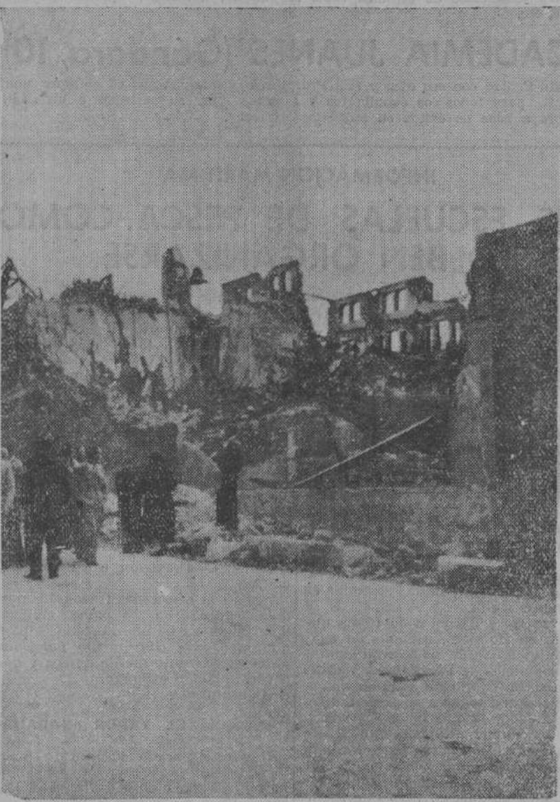
Uno de los hechos más terroríficos de los sucesos de Oviedo fué el de la voladura, por los revolucionarios, del edificio del Instituto, cuando llegó la hora de la huida ante el avance de las tropas. La foto, hecha por nuestro distinguido amigo don José Luis Negrete, da idea exacta de lo enorme de la explosión.

¡Oh, si pudiésemos dar de comer a todos, absolutamente a todos los niños pobres de Santander! Más de mil pequeños acudían diariamente el pasado invierno, a los Comedores por vuestra generosidad abiertos; pero, ¿cuántos, a pesar de nuestra buena voluntad, quedaron desatendidos?... Quen haya visitado alguna vez estos comedores, habrá visto numerosos niños que, cogiendo el bollo de pan, empezaban a ahuecarlo, quitándole la migaja interior. Preguntad a cualquiera de ellos: ¿Para qué haces eso, niño querido? Y o: responderá: Para meter aquí el huevo, la carne o el chorizo que me van dar, y llevarselo a mi hermano que está en casa y no tiene que comer... Las lágrimas humedecieron mis ho-