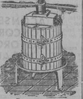
Prensas para uva y estrujadoras para uva. Mecanizadas para uva.