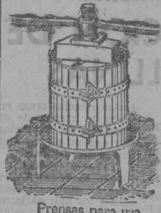
Prensas para una y dos hojas desde 70 Ptas. Estrujadoras para una y dos hojas desde 100 Ptas.

BALANZAS AUTOMÁTICAS Y BASCULAS. Reparaciones por personal especializado en la fábrica de básculas Constructora Montañesa, calle Federico Vial. SOMBREROS, gorras, botas, últimas novedades Precios reducidos. Casa Herrero (antiguo dependiente de Rivero), San Francisco, número 22. CONTRATISTAS DE OBRAS. En los talleres «Bustamante» encontrarán toda clase de carpintería en inmejorables condiciones. Especialidad en escaleras. Detalles: Luis Herberos, Torrelavega. ALFA, la mejor máquina de coser y bordar. Agente general: Casa Musicator, Lealtad, 9. Ventas al contado y plazos. Fonógrafos y discos. AUTOMOVILES y camiones de ocasión: Dos «Ford» 1933, chasis largo, ruedas gemelas. Omnibus «Fiat», 14 plazas. Un «Peugeot» 10 H. P., cabriolet, 4 plazas. Un «Chevrolet» sedan, 5 plazas. Un «Essex» sedan, 5 plazas. Un «Chrysler» coupé, 24 plazas. Un «Whipnet» sedan, 5 plazas. Un «Fiat» sedan 501 y otras varias marcas. Garaje Central, General Espartero, 5. OCASION: Magníficas camisas turcas forradas en tapicería, pesetas 30. Butacas muy confortables, con maderas vistas últimas