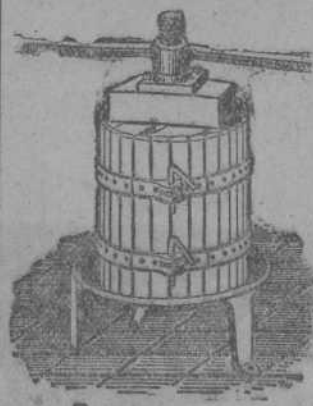
Prensas para uva y mazorcas desde 70 Ptas. Estrujadoras para uva. Mechadoras para mazorcas.

tas. TAPICERIAS MARIN Blanca, 1. primero.