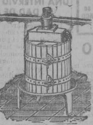
Prensas para lva y manzana desde 70 Ptas. Estrujadoras para lva. Mochedoras para manzana.

INSTALACION motores, bobinaje: toda clase de reparaciones. D. Campocastro. Llamad teléfono 19-06.