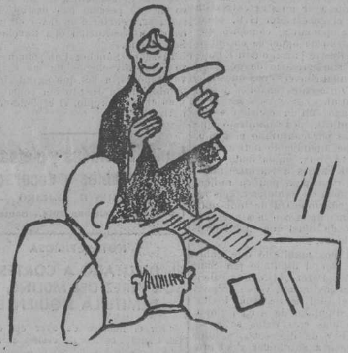
CONSEJO DE ADMINISTRACION

El presidente.—Me complace muy especialmente en notificarles que hemos logrado un millón de pesetas de beneficios con nuestra loción contra la calvicie.