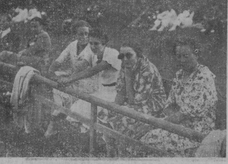
Tardes del tenis... Entusiasmo deportivo—reflejado también en la atención con que los muchachitos servidores de pista siguen las incidencias de los partidos—, ambiente aristocrático, luz, belleza... Las pistas de la Sociedad cobrarán en breve un nuevo prestigio con la actuación de famosos «ases» mundiales.