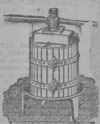
Prensas para tva y manzana desde 70 Ptas. Estrujadoras para tva. Moliendos para harina.

coupe, 24 plazas. Un «Whippet» sedan, 5 plazas. Un «Flat» sedan 501 y otras varias marcas. Garage Central, General Espartero, 5.