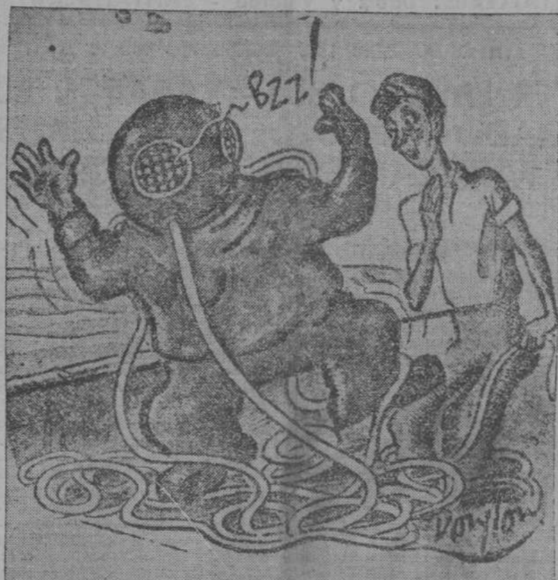
—¡Redre! ¡Se me ha metido una avispa dentro de la escandalía!