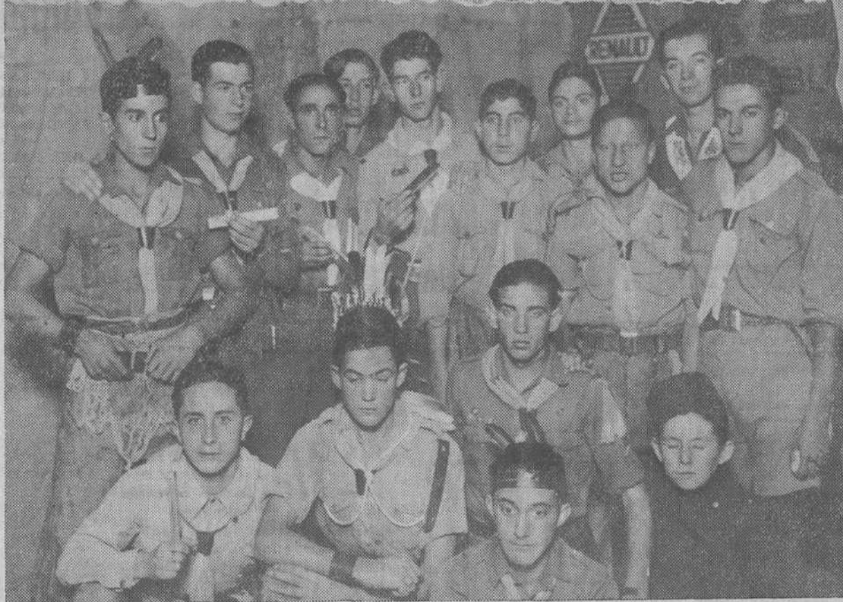
Un aspecto del salón de la Feria de Muestras durante la fiesta de los Exploradores.—«Boy-scouts» santanderinos que tomaron parte en el brillante festival.

El pasado domingo, a las once de la mañana, en la Feria de Muestras, tuvo lugar el festival infantil organizado por los entusiastas exploradores santanderinos en honor de los niños de las escuelas públicas. El espacio local se hallaba completamente lleno.