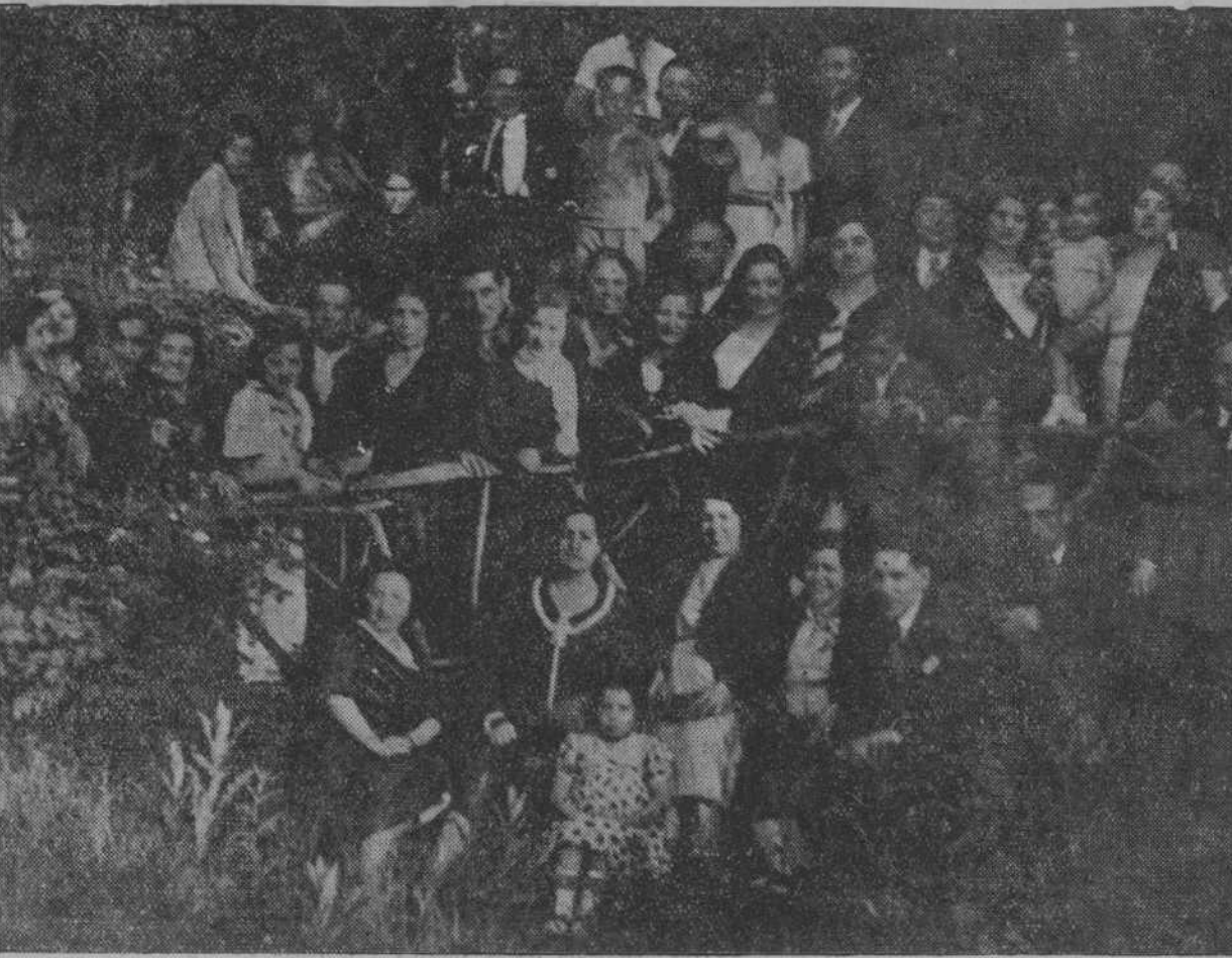
El domingo fué a Burgos la excursión del Ateneo Popular, que obtuvo en la ilustre ciudad castellana un grandioso recibimiento. Los excursionistas santanderinos fueron colmados de exquisitas atenciones. Por la tarde, invitados por el Ateneo Popular burgalés, visitaron el delicioso lugar de «Fuentes Blancas», que es donde Hojas hizo este animado grupo de expedicionarios montañeses.