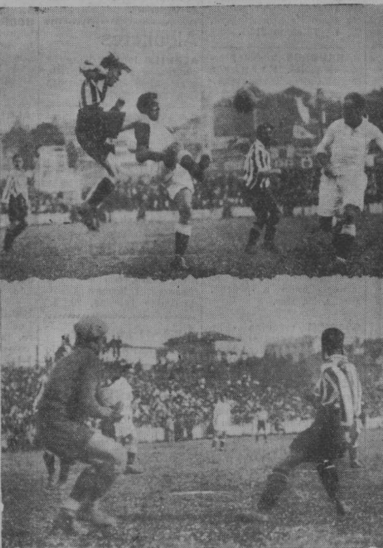
EL DOMINGO EN EL SARDINERO—Dos interesantes fases del match Racing-Madrid, que terminó con empate a un goal y con la eliminación del Racing. Las fotos representan dos momentos de decidido acoso de los madrileños a los dominios de Soia.