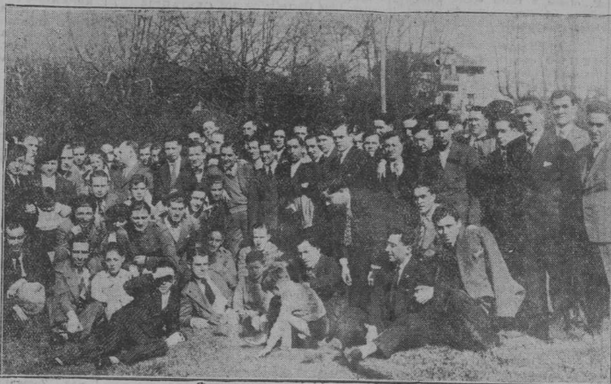
Grupo de obreros gráficos santanderinos asistentes al banquete celebrado en La Albericia con motivo del cincuenta aniversario de la fundación de su Sociedad.

El domingo celebraron los obreros gráficos santanderinos el 50 aniversario de la fundación de su sociedad, con un importante acto sindical, que tuvo lugar en la Casa del Pueblo, artísticamente adornada, y ante un numeroso público que llenaba por completo el salón, dándose la nota simpática de ser casi la mayoría del público femenino, prueba irrefutable de las simpatías con que cuenta la veterana Sociedad «La Gráfica».