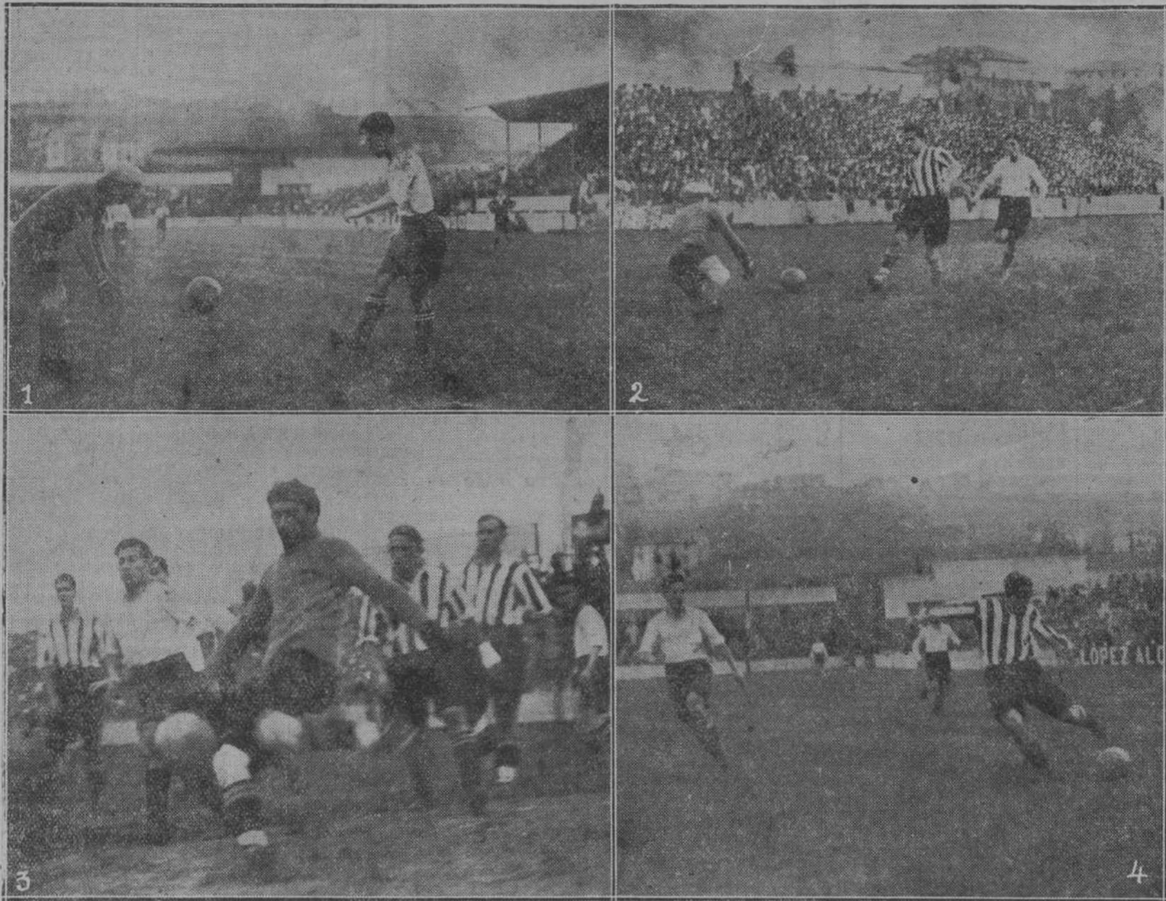
RACING-ATHLETIC EN EL SARDINERO.—1, Hernández, en su reaparición, haciendo un saque para Solá.—2, El portero racinguista, ante la inminencia del peligro, sale y arrebatada de los pies de Bata una pelota.—3, Uno de los numerosos accesos del Racing, en que se ve a Ispizua despejar de pie y apuradamente.—4, "Bata Roja" ametrallando a Solá... sin éxito.