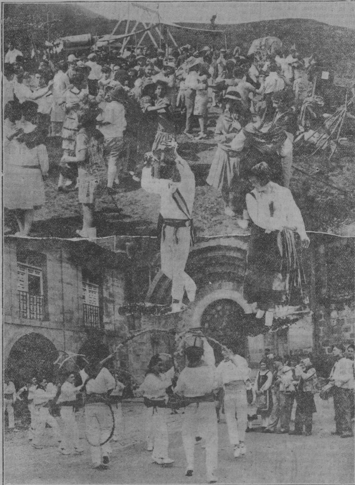
La Montaña arde en fiestas por los cuatro cardinales y honra a sus Patronos, derrochando contento y tipicismo. Romerías, danzas, pito y tamboril, “a lo alto y a lo bajo”, todo en esmerados campestres o en plazas enriquecidas por la sobria arquitectura montañesa. La composición de Alejandro recoge varios momentos de esas típicas fiestas que los pueblos celebran, mientras se divierten...