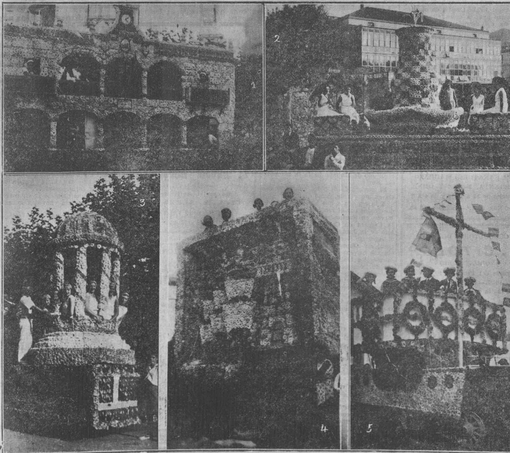
DE LA BATALLA DE FLORES DE LAREDO.—He aquí algunas de las bellas carrozas presentadas: 1, «Artística fachada del Ayuntamiento de Laredo», primer premio; 2, «Surtidor», tercer premio; 3, «Gloriosa», segundo premio; 4, «Escudo de Laredo», quinto premio; 5, «Puerto de barcos», presentada fuera de concurso por la Sociedad de Pescadores.

El gran número de amigos y admiradores con que cuenta el ilustre artista en Santander nos permite asegurar que el concierto se celebrará con arreglo a un programa seleccionado por el propio artista con especial cariño.