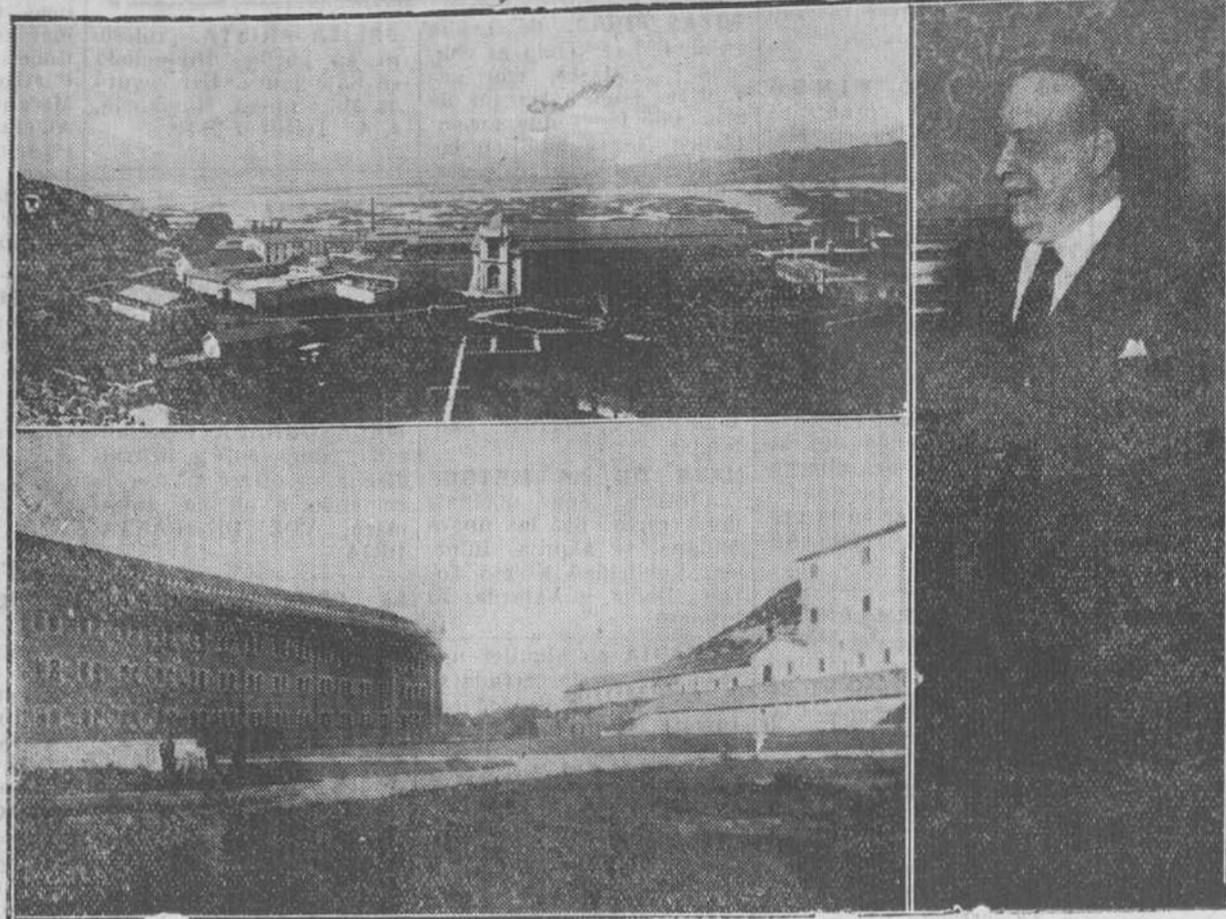
Vista general de la Colonia Penitenciaria del Dueso.—El primer periodo del Penal, en el que tiene su celda don José Sanjurjo.—Última fotografía del general, hecha el día de la vista del juicio sumarísimo.