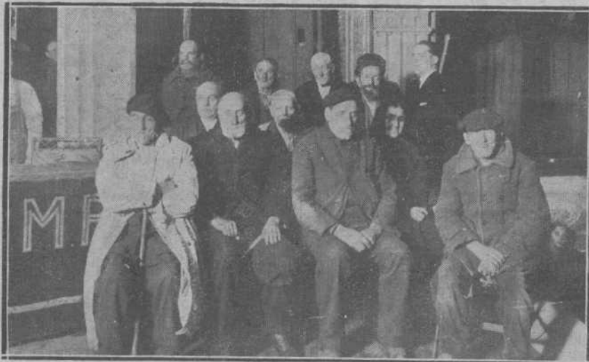
Grupo de ancianos a los que se han concedido pensiones por el Patronato de Homenajes a la Vejez y a Vejez del Marino.

En el Manicomio de Valladolid serán recluidos cuatro dementes.