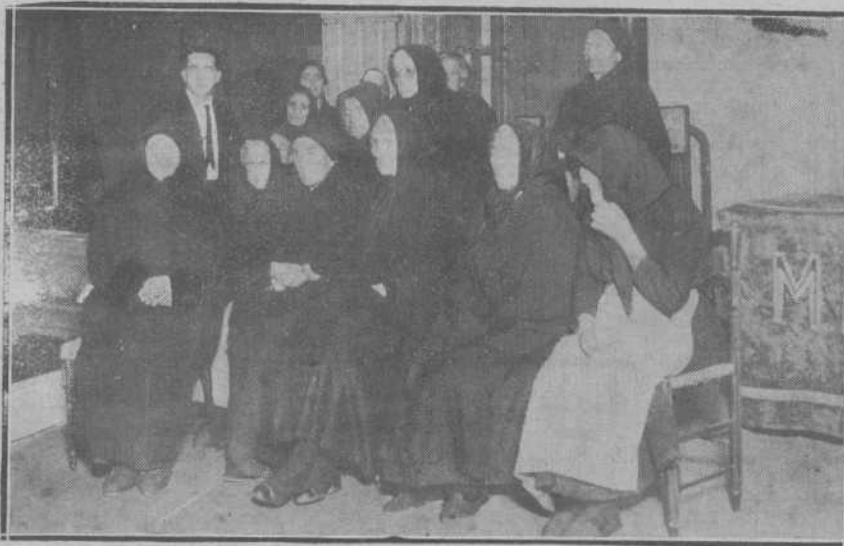
Ancianas premiadas con cartillas de pensión en el acto del domingo en el teatro Pereda.

Brillantisima, por su alta significación, resultó la fiesta celebrada el domingo pasado en el Teatro Pereda, organizada por los Patronatos del Homenaje a la Vejez y a la Vejez del Marino, instituciones que desde su creación vienen realizando una función social altamente beneficiosa y digna de todo elogio. Los miembros de ambos Patronatos, de Santander, no desmayan en la obra emprendida, y cada año ven acrecidos los beneficios que se derivan de esas instituciones, ampliando cada vez más el volumen de las pensiones concedidas, con las que se premian tantas inestimables virtudes. En la Montaña, donde existen muchos ancianos de edad avanzadísima, hay ejemplos meritorios que se atraen la atención oficial. Santander, pues, rindió el pasado domingo un gran homenaje a los buenos ancianos, encanecidos en el trabajo, y fortalecidos por honrosísimas cualidades cívicas. Si el premio a estas virtudes no es tan grande como la intención de los Patronatos deseara, no por ello es menos estimable y significativo.