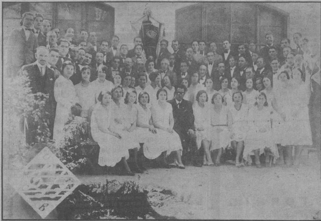
La notable agrupación artística Orfeón Buralés que mañana, domin go, llegará a nuestra ciudad.