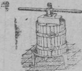
Prensas para uva y manzana desde 70 Pts Estrujadoras para uva Machacadoras para manzana Folio catálogo - MATIAS GRUBER BILBAO, Alameda de Marqués 19 y 21

«CITROEN», 5 HP., trebol, 1.500 pesetas; «Fiat», 8 HP., roadster, dos asientos, y «Citroen», B 14, cupé, se venden. San José, 6, garaje.