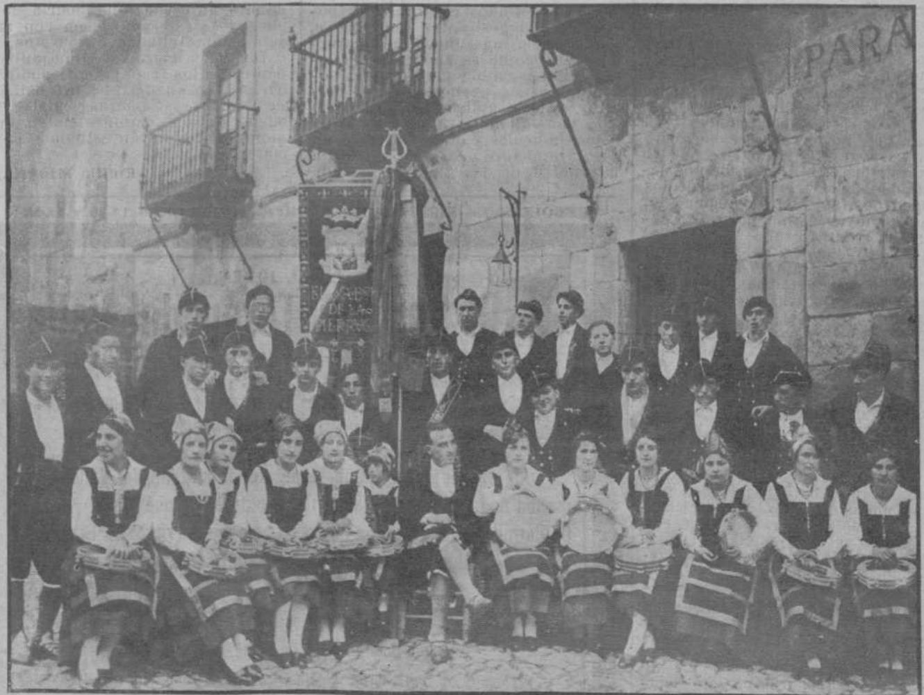
He aquí la popular agrupación "El Sabor de la Tierrauca" que en las funciones de ayer en el Teatro Pereda dió un paso definitivo en el camino de su consagración artística.