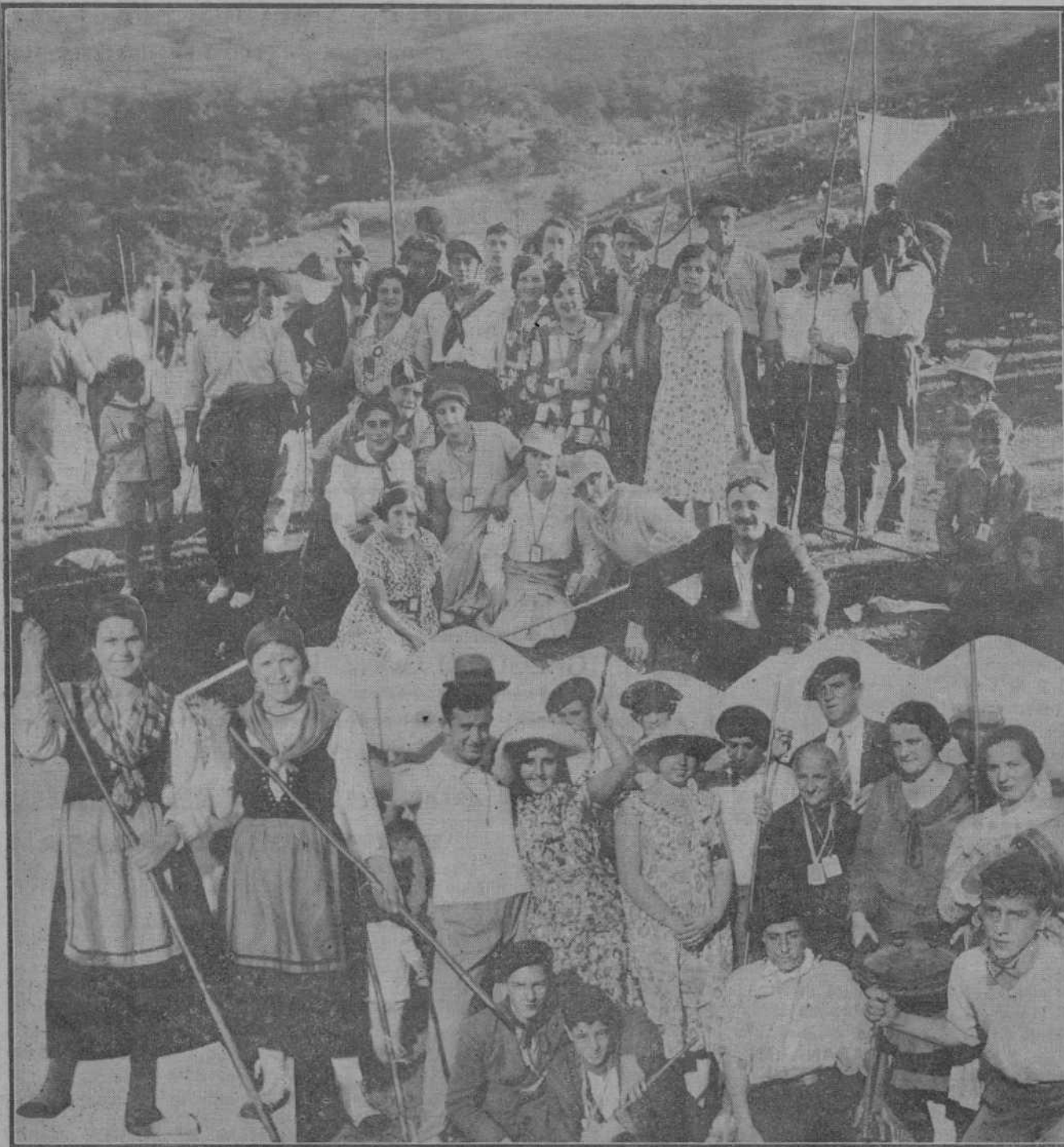
LA TIPICA ROMERIA DE SAN CIPRIANO EN COCHILLOS.—Grupos de bellas romeras y jóvenes romeros en la pradera de Cochillos, donde se celebra la llamada "romería de los palos".