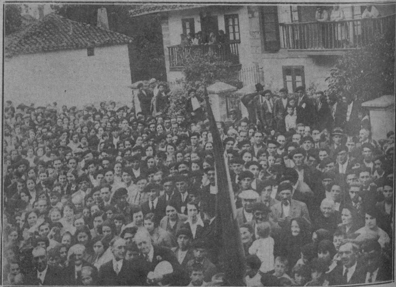
EL DOMINGO EN SANTA CRUZ DE IGUÑA.—El vecindario de Santa Cruz estacionado ante la casa en que nació el poeta montañés Evaristo Silió, en el momento en que era descubierta la lápida conmemorativa.

Escribir a la señorita Modesta Puvicino, plaza de Castelar, Zaragoza. —Urgente.—La Comisión.