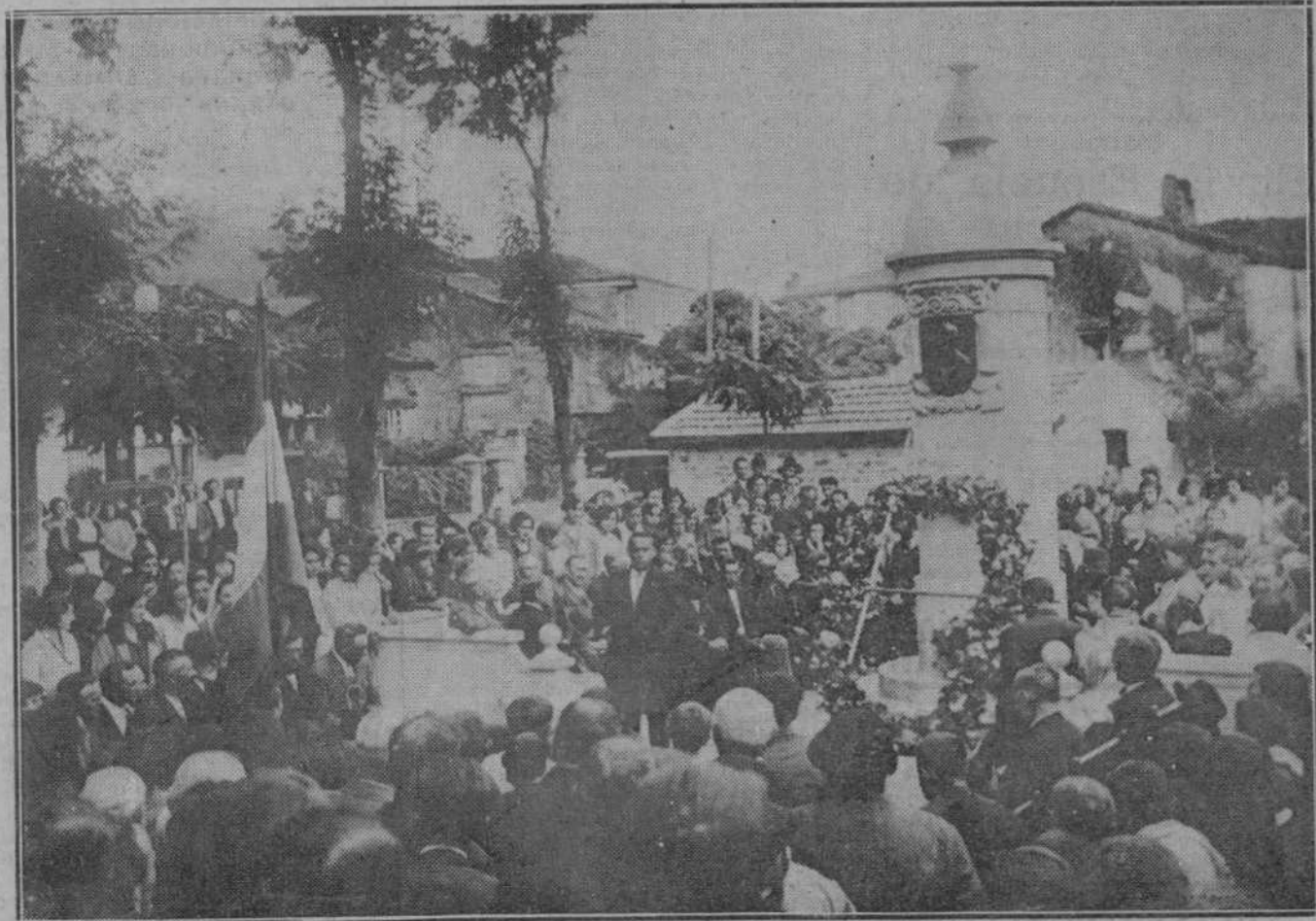
EL DOMINGO EN SANTA CRUZ DE IGUSA.—El monumento erigido para perpetuar la memoria del filántropo don Luis Bustamante y Quevedo. Momento de pronunciar su discurso el maestro nacional de Santa Cruz.

—En efecto, la vuelta a Madrid de los hombres públicos, después del descanso veraniego, en que no ocurre nunca nada importante en este orden de cosas, suele hacer caer las hojas a que