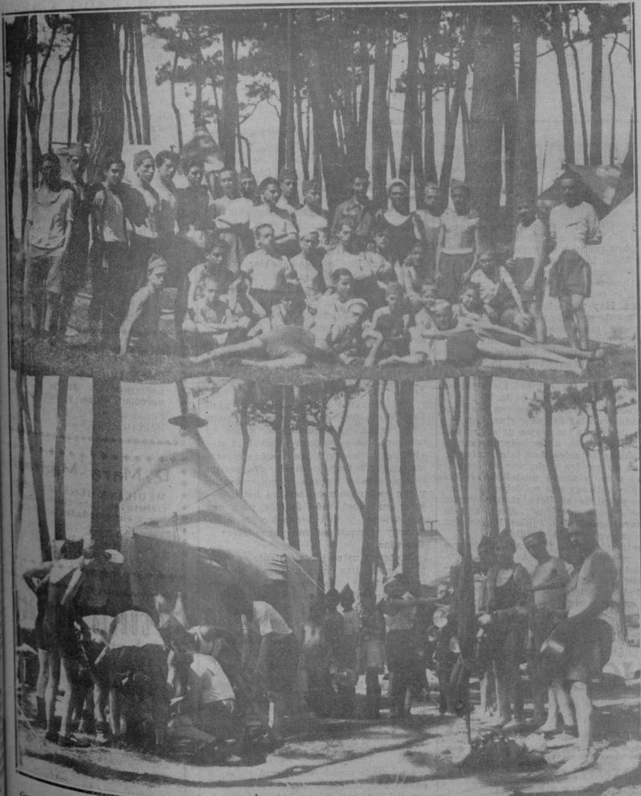
Grupo de los exploradores vallisoletanos, acampados estos días en los pinares de Cabo Mayor.—Un detalle de la vida al aire libre la hora de la comida.

El precio será de 1.25 pesetas. Inscripciones y detalles en Secretaría, de ocho a nueve y media de la noche, hasta mañana, sábado.