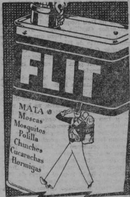
Flit mata más rápido. Bidón amarillo - franja negra.