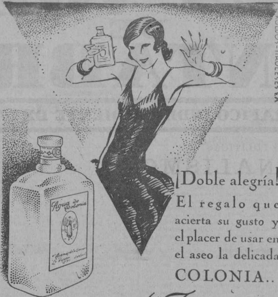
ROLDOS-TIROLESES & CA

¡Doble alegría! El regalo que acierta su gusto y el placer de usar en el aseo la delicada COLONIA..