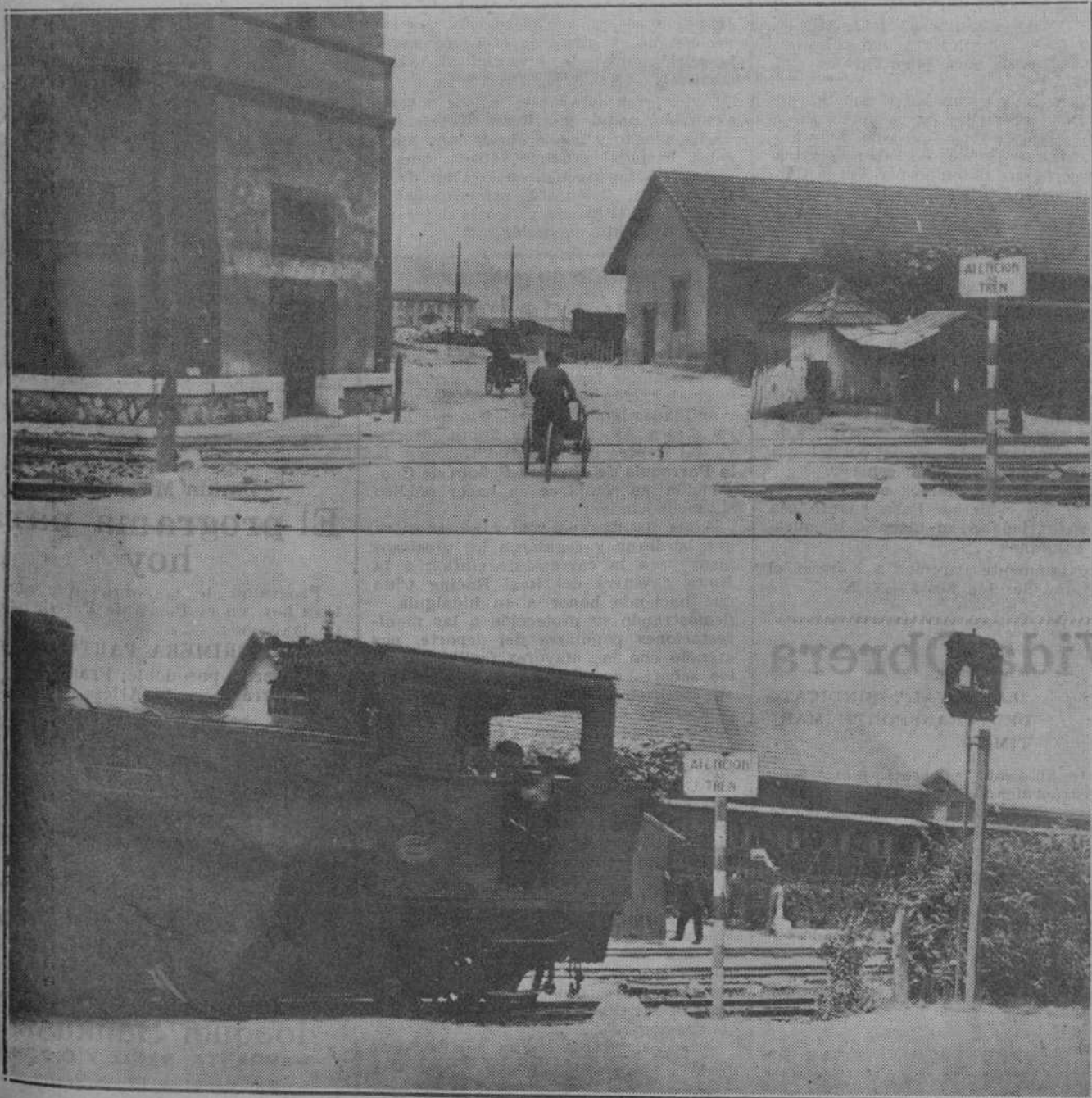
El paso a nivel próximo a la estación de pequeña velocidad, donde ayer ocurrió un accidente, y al que se refiere el comentario que publica mos en otro lugar de este número.