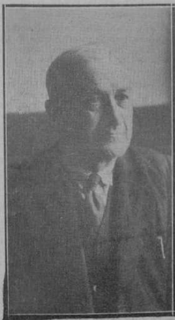
DON FELIPE DEL CASTILLO alcalde de Astillero, nombrado de Real orden.