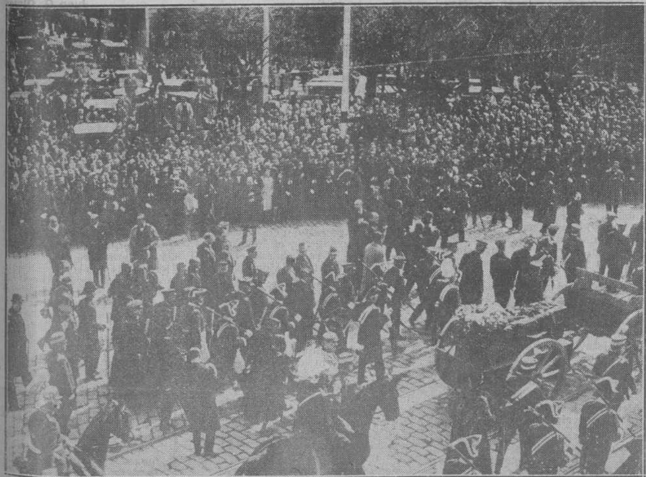
EL ENTIERRO DEL GENERAL PRIMO DE RIVERA.—Momento de ser sacado el féretro de la estación del Norte.

Pedía hace unos días el diario vespertino La Región un homenaje de la provincia a ese gran montañés, maestro de