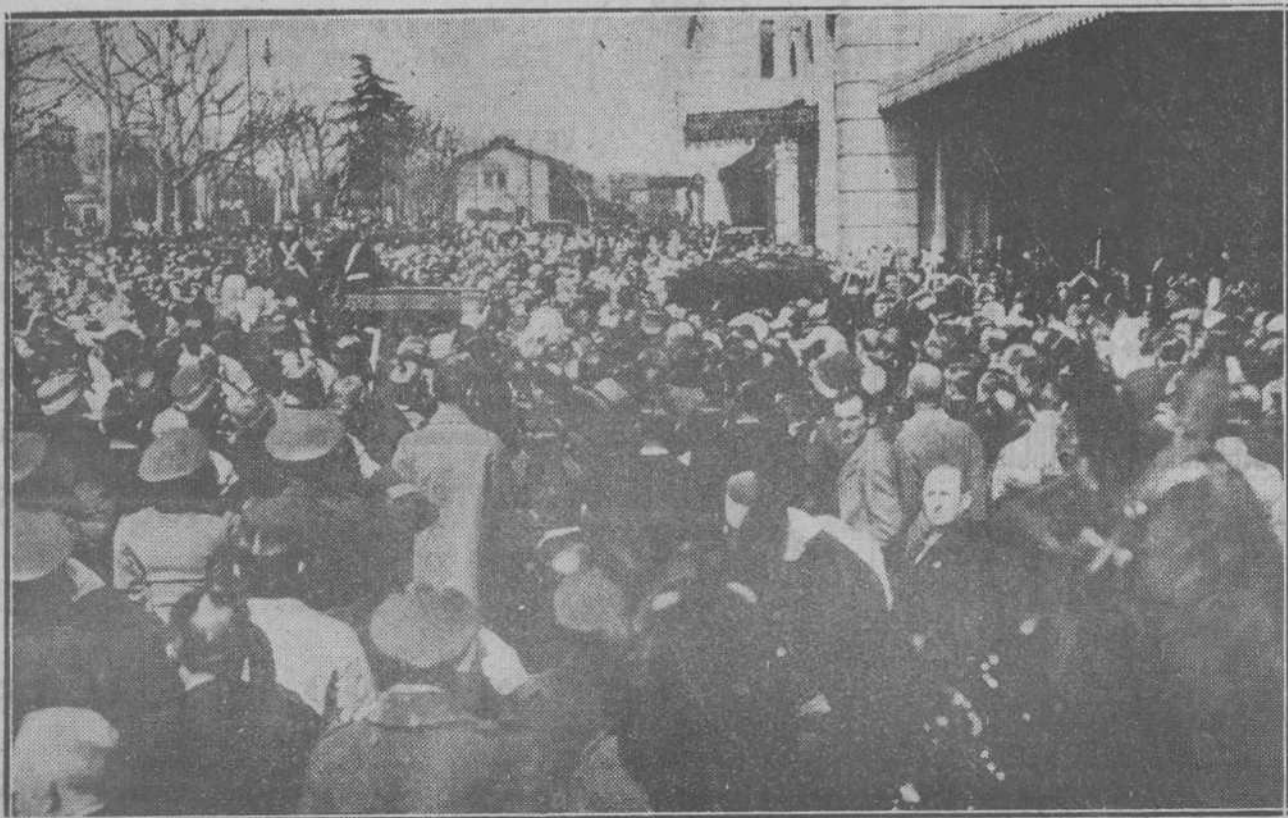
EL ENTIERRO DEL MARQUES DE ESTELLA. — La comitiva fúnebre en marcha.